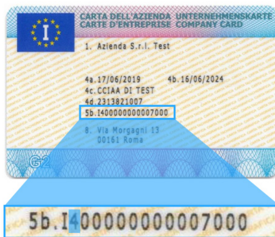
NUOVA CARTA E NUOVA NUMERAZIONE