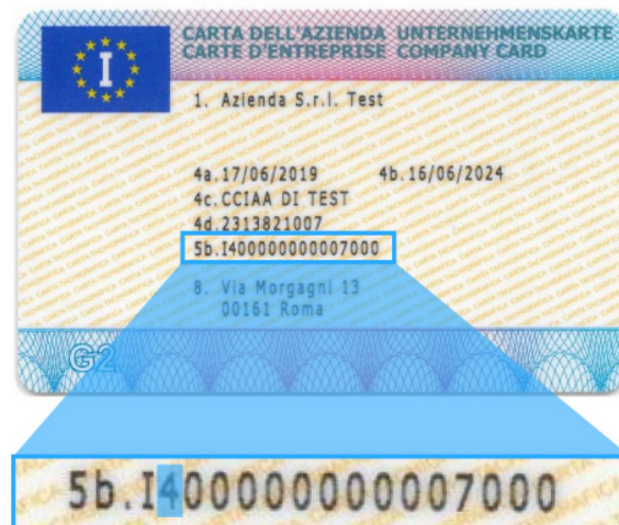
NUOVA CARTA E NUOVA NUMERAZIONE